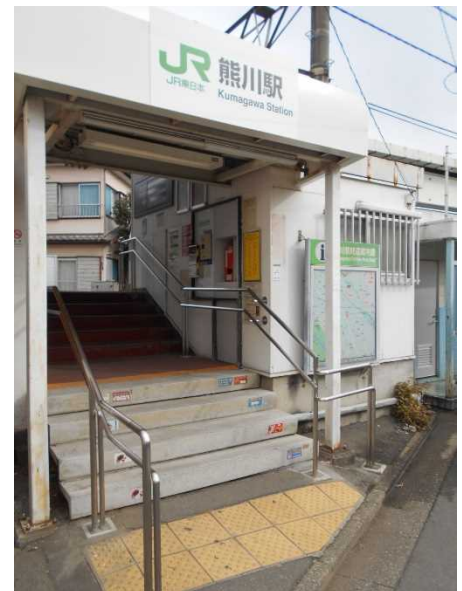
▲現在の熊川駅の様子