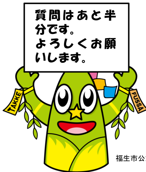
福生市公式キャラクター「たっけー☆☆」