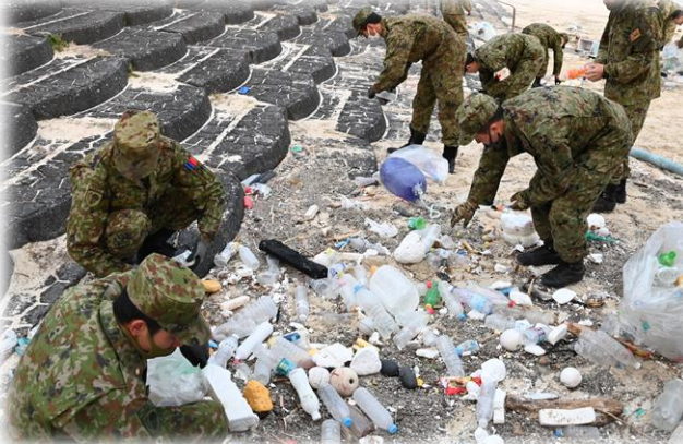
地域貢献活動（海岸清掃）