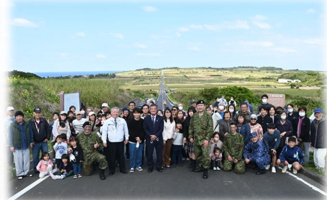
地域交流（集合写真）