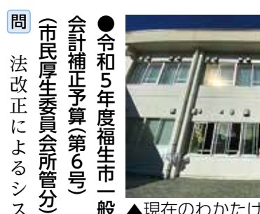
▲現在のわかたけクラブ

問 令和6年度の3千80万円は、令和4年度決算の約7・6%増を見込む数字で、令和7年度から令和10年度にかけては、人口減少による利用者の減少を見込み、前年度比0・5%ずつ減額した計画としている。令和6年度中に自動精算機及び電磁ロック式の駐輪ラックを設置後、管理員の配置を見直す。