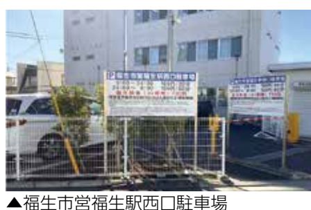
▲福生市営福生駅西口駐車場

問 福生市自転車駐車場の指定管理者の指定について 答 収支計画支出のその他の内訳について伺う。 答 駐車場機器等に要する光熱水費、駐車券・レシート等の消耗品費、修繕費、通信運搬費、予備費などが含まれる。