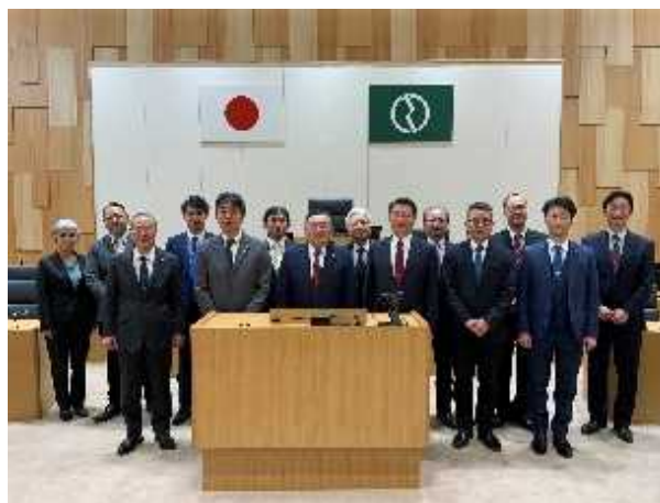
府中市議会議場にて

府中市は、東京都のほぼ中央に位置し、副都心新宿から西方約22kmの距離にある。まちの歴史は古く、今から約1,370年前の大化の改新（645年）により武蔵国の「国府」が現在の府中市に置かれたときに始まる。鎌倉時代には鎌倉街道が、江戸時代には五街道の一つである甲州街道が整備されるなど、交通の要所として栄え、甲州街道においては大きな宿場町として知られていた。