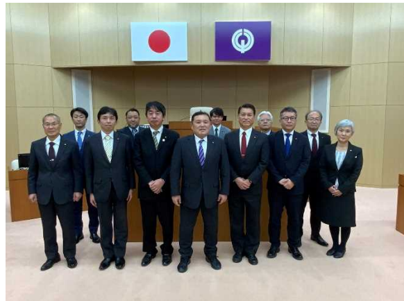
清瀬市議会議場にて

市内には金山緑地公園など緑地が多く、緑地面積は市域の約46%を占める。また、農業も盛んで、市の面積の約18%を農地が占めている。特に関東ローム層の黒土が深いことから、にんじんやごぼう、大根、里芋などの根菜類の栽培に適し、古くから都内有数の産地となってきた。昭和30年代からは、にんじんの栽培が盛んになり、現在は約7割の農家がにんじんを生産し、作付け面積、生産量ともに東京都で第1位の生産地になっている。