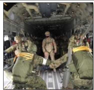
機内での降下準備