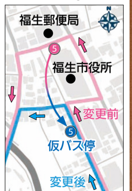
▲変更後の仮バス停