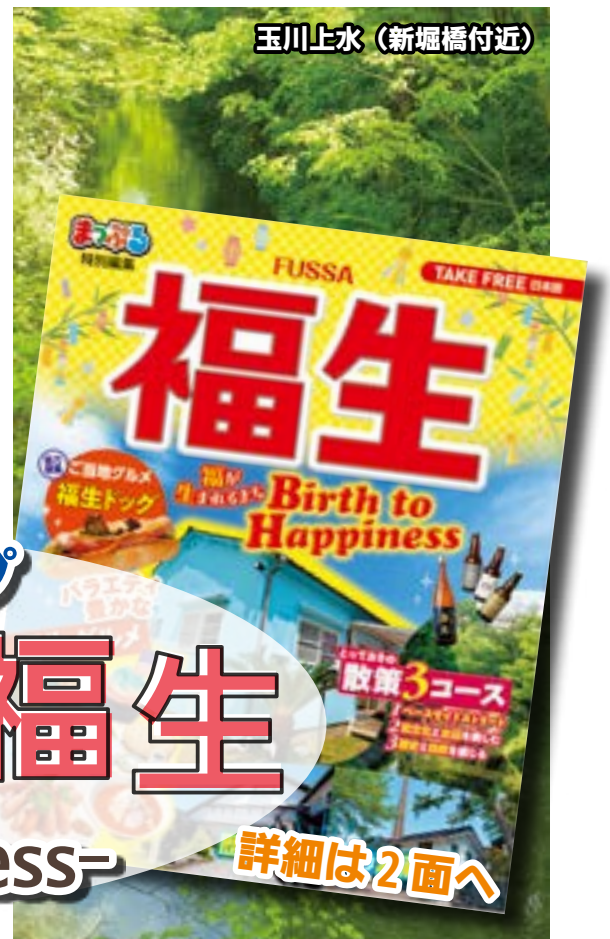
玉川上水 (新堀橋付近)