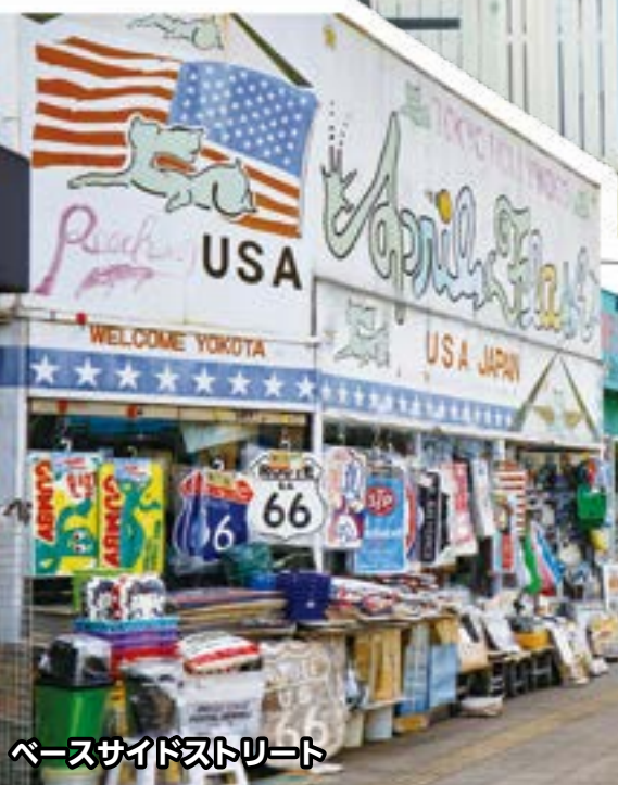
ベースサイドストリート