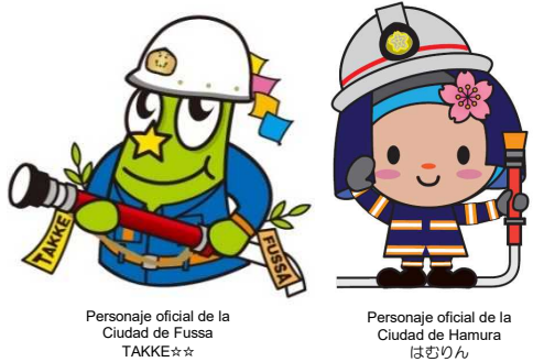
Personaje oficial de la Ciudad de Fussa TAKKE☆☆