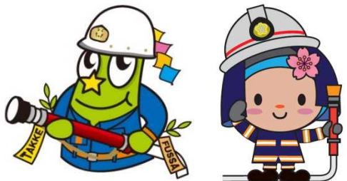
福生市官方卡通人物 TAKKE☆☆