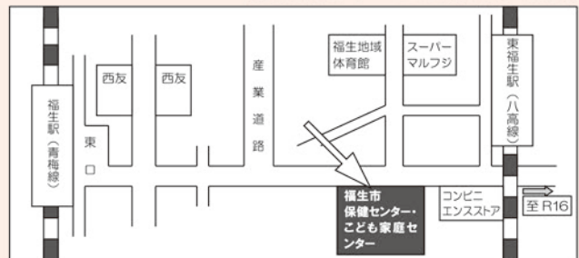
福生市保健センター・子ども家庭センター案内図

電話番号 母子保健係 042-552-0312 子ども家庭支援係 042-539-2555