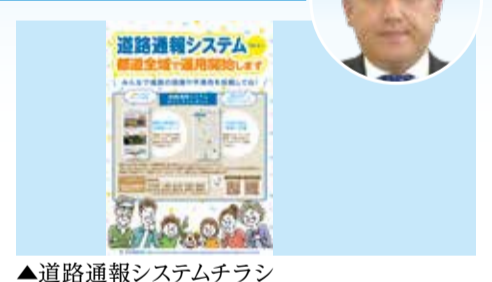
▲道路通報システムチラシ

市長 用地は令和3年度中に約83%を確保している。また、沿道の無電柱化を含め、道路設計の見直しを進めており、今後は、事業期間の延伸に向けて認可者である東京都と協議に入る予定である。