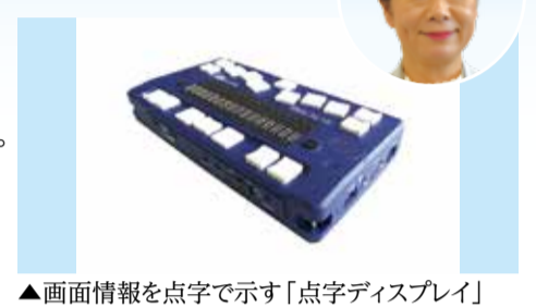
▲画面情報を点字で示す「点字ディスプレイ」

市長 メタバースは発展途上の概念で課題も多い。今後、本市の課題解決の手段の一つとして、適した施策での活用に向け研究したい。