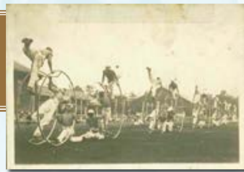
▲東京陸軍少年飛行兵学校の訓練の様子

【申込方法】7月1日(金)～22日(金)(必着)までに、右記QRコードから市ホームページの申込用フォームに必要