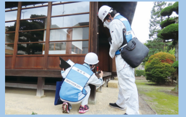
▲住家被害認定調査訓練を行う市職員

10月16日に、福生市総合防災訓練を実施しました。市内の小・中学校や公共施設等で、実際の災害を想定した避難所の開設などを実施しました。