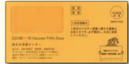
▲5回目接種の書類を送付する封筒（オレンジ色）

12歳以上の方で、4回目接種時に福生市に住民票がある方のスケジュールです。4回目接種後に福生市に転入された方は、接種券の発行申請が必要です（下記「接種券をお持ちでない方の申請方法」を参照）。なお、3～4回目の接種券についても接種間隔の短縮に伴い、順次発送します。