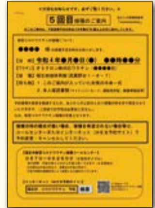
▲60歳以上の方へ送付する5回目接種のご案内