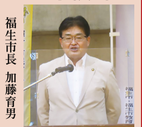
福生市長 加藤育男 令和4年度福生市民総合体育大会総合開会式にて