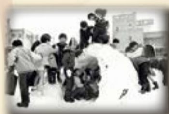
▲昭和50年ごろの一小の子どもたち