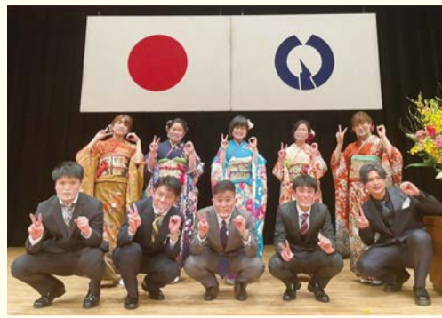
▲令和4年成人式実行委員の皆さん

※説明会は1時間程度で、2回とも同じ内容です。どちらか都合のつく日にご出席ください。 ▼ 令和5年成人式について 【日時】令和5年1月9日(祝) <受付開始> 正午～ <式典> 午後1時～ ※今後、変更となる可能性があります。 【場所】市民会館大ホール（もくせいホール） 【対象】市内在住で平成14年4月2日～平成15年4月1日に出生した方 【問合せ】生涯学習推進課地域教育支援係 ☎ 551・1958