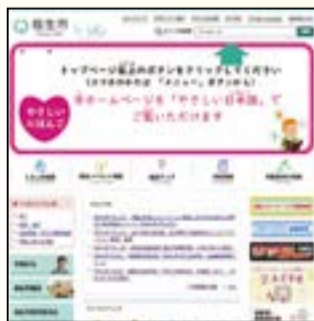
▲市ホームページトップページ

【広告の規格】天地50ピクセル、左右180ピクセル、10キロバイト以内、GIF形式(GIFアニメ不可)、静止画、画像の点滅は不可