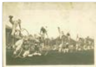
▲東京陸軍少年飛行兵学校の訓練の様子