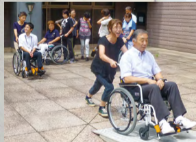
車いす研修会（平成29年）