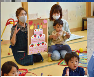
子育てサロン「はとぼっぼ」

民生委員は児童委員を兼ねており、日々の見守りや子育てサロンの実施など、子育てのサポーターとしての役割も担っています。