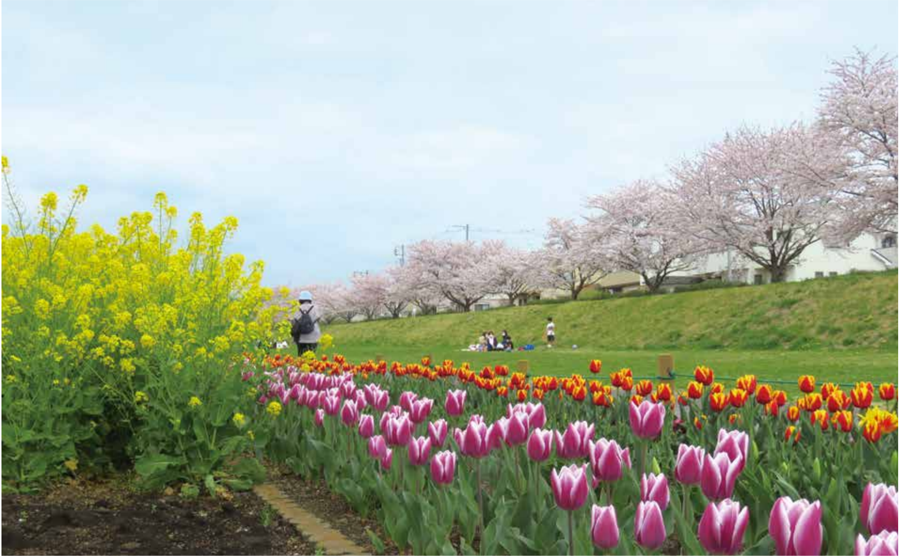
▲多摩川中央公園の菜の花とチューリップ越しに見える桜