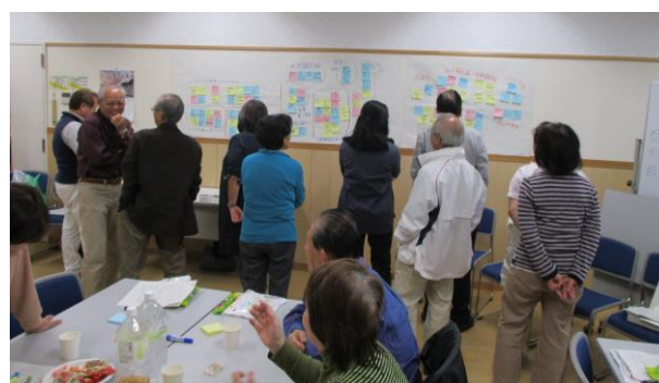
令和元年度の地域懇談会の様子