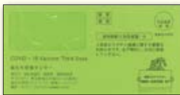
▲3回目接種の書類をお送りする封筒はこちらです(緑色)