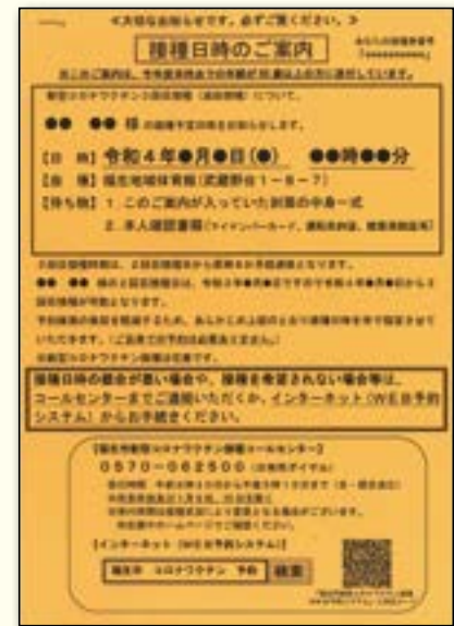
▲接種日時のご案内

一部の方(※)を除き、65歳以上の方は接種日時を指定させていただきます。上記の「接種日時のご案内」(オレンジ色の紙)が同封されますのでご確認ください。