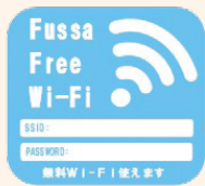
▲このステッカーが目印です

次の公共施設等で、Wi-Fi機能が搭載された端末を使用してインターネットに接続することができます。この度、新たに7施設が追加され、利用できる施設が、現在14施設となりました。利用可能な場所に貼られているステッカーに記載されたSSIDを選択し、パスワードを入力することで、無料でご利用いただけます。