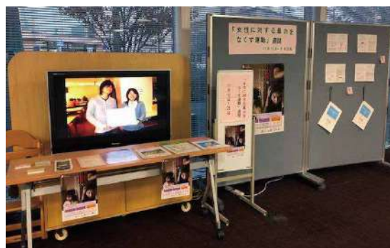
市役所1階特設コーナーでの展示