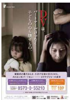
令和元年度女性に対する暴力をなくす運動ポスター

暴力は、その対象の性別や加害者、被害者の間柄を問わず、決して許されるものではありません。特に、配偶者からの暴力、性犯罪、ストーカー行為、売買春、人身取引、セクシュアル・ハラスメント等、女性に対する暴力は、女性の人権を著しく侵害するものであり、男女共同参画社会を形成していく上で克服すべき重要な課題です。女性の人権の尊重のための意識啓発や教育の充実に図ることが大切です。