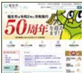
▲市ホームページトップページ

【広告の規格】天地50ピクセル、左右180ピクセル、10キロバイト、GIF形式(GIFアニメ不可)、静止画、画像の点滅は不可 ※広告の内容によっては、掲載をお受けできない場合があります。