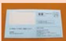
▲市が送付した封筒

申請期限(オンライン申請含む)は8月25日(火)と迫っています(当日消印有効)。