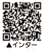
▲インターネット中継

へお問い合わせください。 ▼議会中継について 本会議のライブ映像および録画映像をインターネットで配信しています。市ホームページまたは右記のQRコードから福生市議会「インターネット中継」にアクセスしてご覧ください。 また、多摩ケーブルネットワーク111チャンネルでも、本会議を放映する予定ですので、ぜひご覧ください。 【問合せ】議会事務局庶務係 ☎ 551・1523