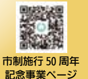
市制施行50周年記念事業ページ