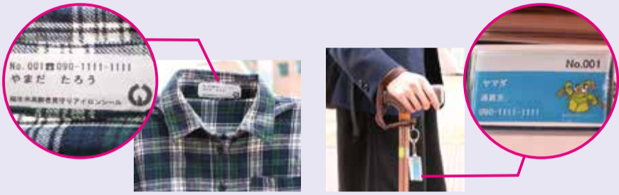
▲アイロンシール使用例

【申込み】印鑑（代理申請の場合、併せて代理人の印鑑）を持参のうえ、市役所1階9番介護福祉課高齢福祉係 ☎ 551・1751 へ。