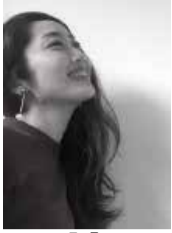
▲ Jura 氏

ポップス、ロック、R&B、ゴスペル、話し声に共通する基本の腹式呼吸発声法を徹底解説し、実践します。