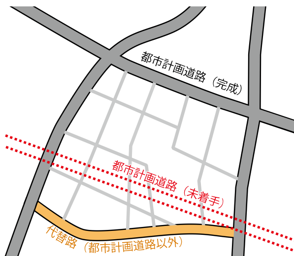
図 3-49 既存道路による代替のイメージ (代替路)

未着手の地域的な都市計画道路の近傍に、都市計画道路が有する機能を代替できる都市計画道路以外の道路がある可能性があります。