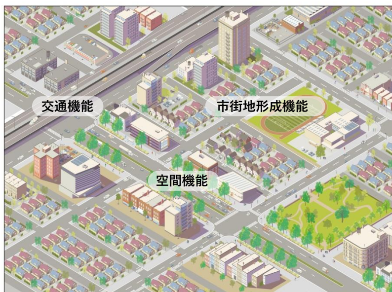
図 3-50 都市計画道路が有する機能