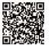
▲ふっさ情報メールQRコード