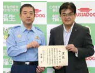
▲市長への受賞報告の様子

「今回このような賞を受賞できたのは、地域住民の皆様の協力があったこそだと思っています。これからも全力で管内の安全・安心を守ってまいります。」