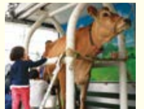
▲昨年の搾乳体験の様子

落花生の掘り取りを親子で体験し、落花生を使ったおいしい昼食を食べましょう。 また、今年も乳牛の搾乳体験を実施します。