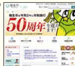
▲市ホームページトップページ

【広告の規格】 天地50ピクセル、左右180ピクセル、10キロバイト、GIF形式（GIFアニメ不可）、静止画、画像の点滅は不可 ※広告の内容によっては、掲載をお受けできない場合があります。