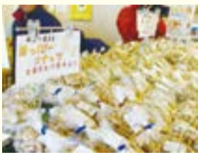
▲直売所で販売している落花生

市内農業者が生産した落花生を、ぜひご賞味ください！ 【日時】 9月24日(火)午前9時～(売り切れ次第終了) 【場所】 JAにしたま福生支店直売所 【問合せ】 JAにしたま福生支店直売所 ☎552・4632、シティセールス推進課産業活性化グループ ☎551・1699