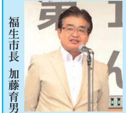
福生市長 加藤育男 第17回ふっさ環境フェスティバルにて