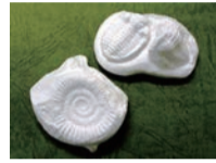
▲石膏でつくった化石のレプリカ