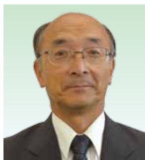
9番 池田 公三 日本共産党 70歳