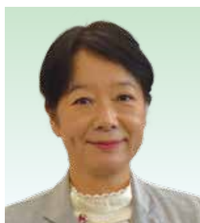
7番 五十嵐みさ 公明党 62歳