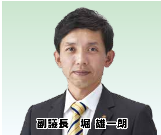
副議長 堀 雄一郎