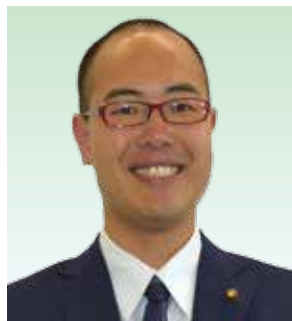
8番 市毛 雅大 日本共産党 39歳