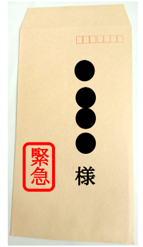
【訴訟関係の偽文書の例】

○このような封書が届き、不安を感じたら、ひとりで悩まずに福生警察署（042-551-0110）に相談しましょう。