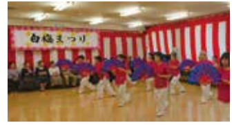
公民館白梅分館利用

公民館白梅分館利用 サークルの活動成果の発表と地域の皆さんの楽しい交流の場です。