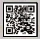
▲民生委員・児童委員ホームページ

お住まいの地区の担当委員をご紹介しますので、まずはお問い合わせください。 【問合せ】社会福祉課福祉総務係 ☎ 551・1522