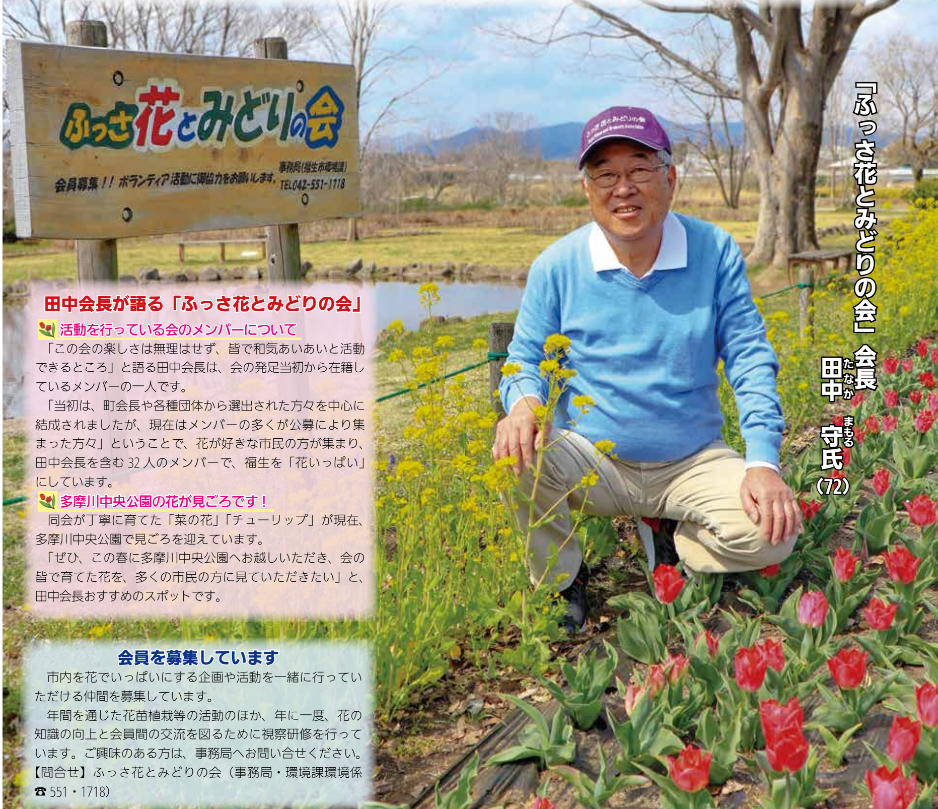
「ふっさ花とみどりの会」会長

また、「花いっぱいコンテスト(春・秋)」と表彰式の開催、地球温暖化防止とみどりの普及のための「みどりのカーテンコンテスト」審査員を務めるなど、緑化推進、啓発活動にも広範に取り組んでいます。