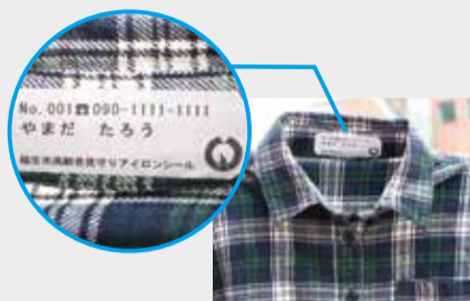
▲アイロンシール使用例

【申込み】3月18日(月)から印鑑(代理申請の場合、併せて代理人の印鑑)を持参のうえ、市役所1階9番介護福祉課高齢福祉係 ☎ 551・1751へ。