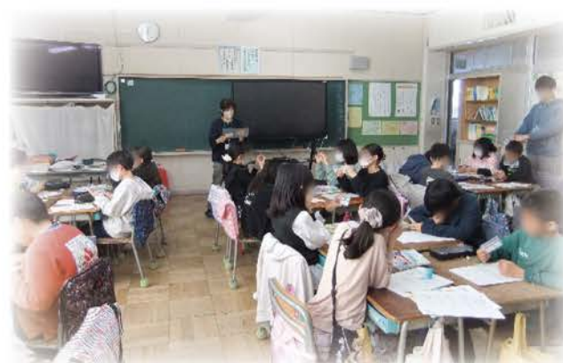
グループで意見交換