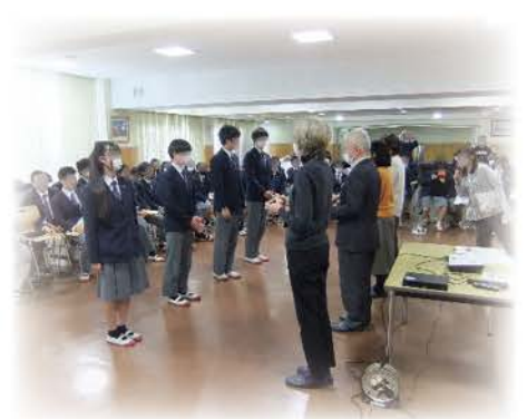
認知症サポーターカード贈呈