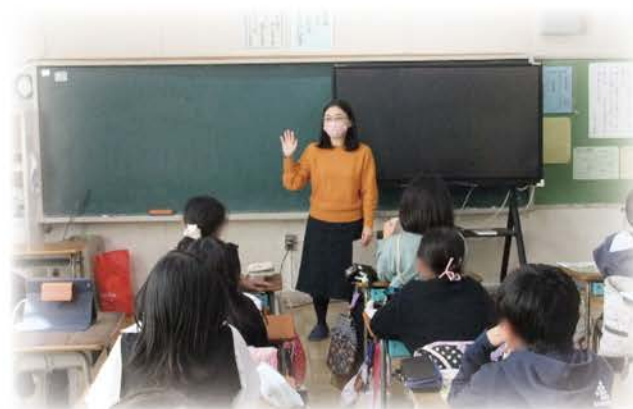
認知症介護の体験談