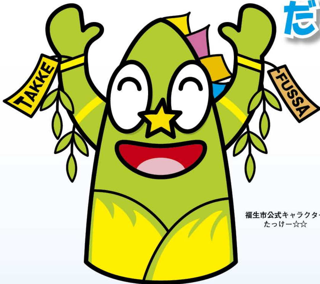
福生市公式キャラクター たっけ☆☆