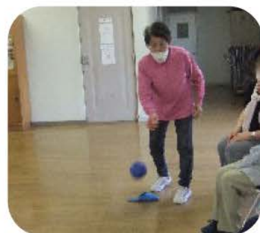
サロンでの体操・ポッチャで健康的に生き生きと!