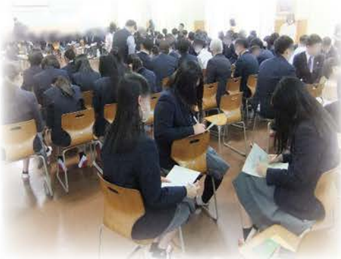
グループワークで意見交換

実体験を用いた説明はとても刺さりました。話すことは苦しいかと思いますが、生の話に触れることで理解が深まった。