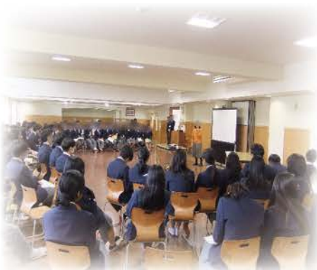
認知症介護の体験談