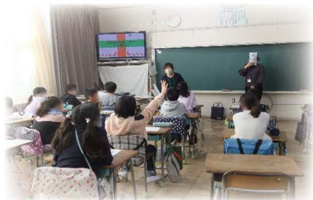
認知症の基礎知識を学ぶ