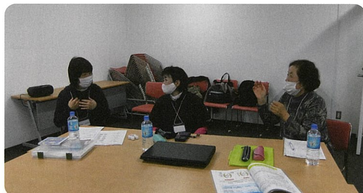
限られた時間で模擬イベントの準備をします