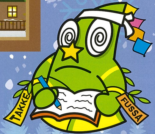
福生市公式キャラクター たっけー