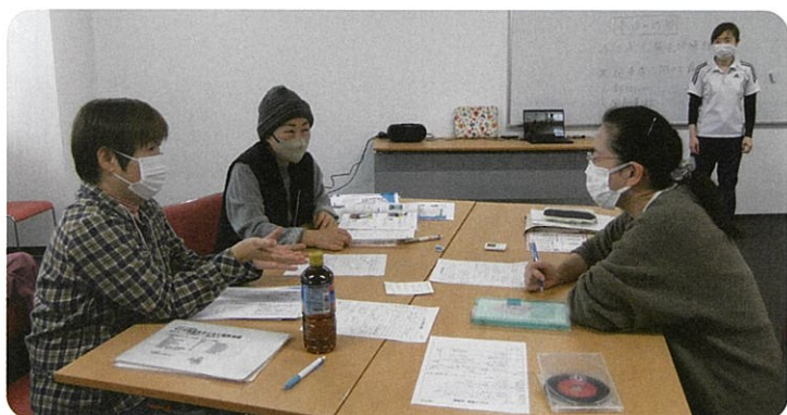
少人数だからこそ、結束！です