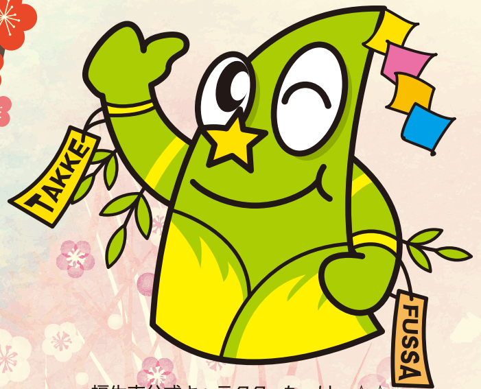
福生市公式キャラクター たっけー☆☆