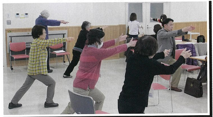
「ふくふく福生体操」の習得に真剣です