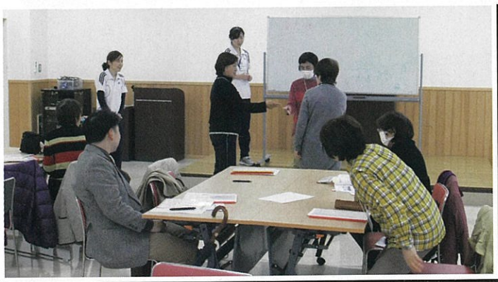
基礎知識や運動実技の実践

講座で「介護予防」の大切さを感じました。 学んだことを多くの方にも伝えたいです。