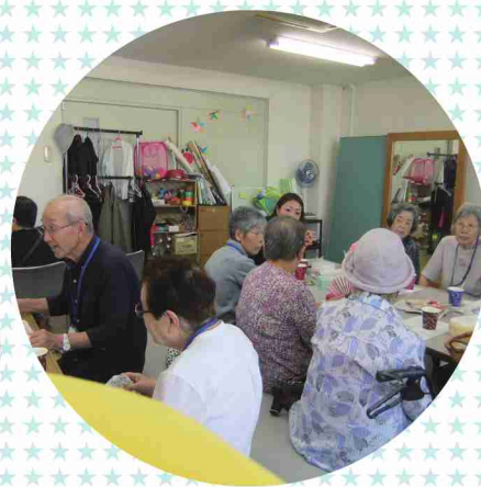
ホッとするティータイム 家族同士、介護の悩みも共有

身近にあるカフェのように気軽にお茶を飲みながら、リラックスした 雰囲気の中で、日頃の介護の悩みや思いを語り合う場です。