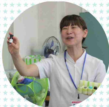
アロマの香りに心も和らぎます