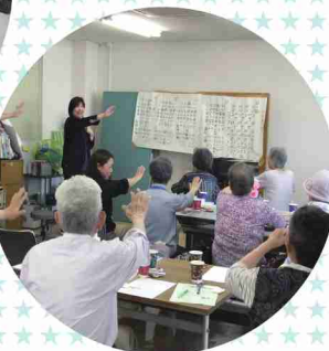
体操で体もリフレッシュ