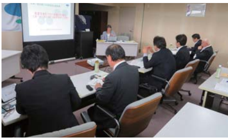
▲滋賀県湖南市の発達支援システムを視察

早期対応から学齢期、学齢期からそれ以降へのつなぎ、これらの連携と職員体制は参考となった。健康福祉部社会福祉課に発達支援室を設置し、その室長は市教委指導主事経験者ということが、教育と福祉の連携におけるポイントとなっている。