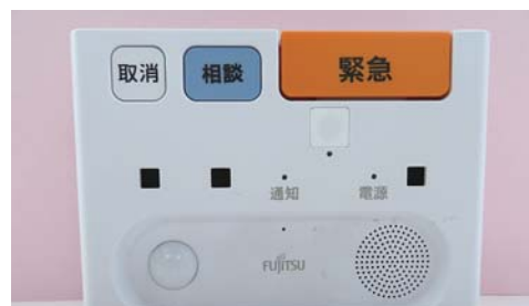
▲見守りシステムの端末機器

答 原価計算をした結果、小さな部屋の基準手数料は、現行料金と比べて低い結果となったため新たに設定する。