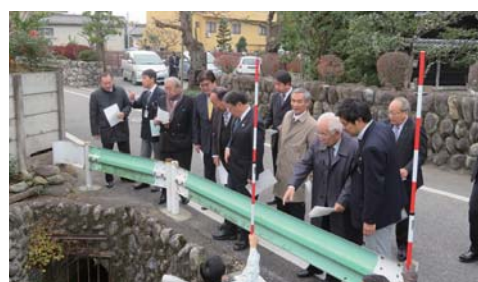
▲市道第269号線を現地視察