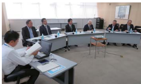
▲富山県富山市の空き家等対策計画及び空き家情報バンクを視察

①急激に進む人口減少により、全国的な問題として空き家対策が求められている。富山市においては先進的な事業を行っており、一定の成果をあげている。具体的な内容としては、空き家基礎調査を徹底的に実施し、パン