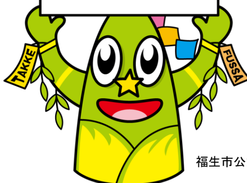
福生市公式キャラクター「たっけー☆☆」