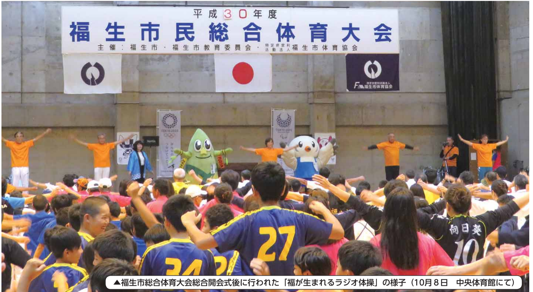
▲福生市総合体育大会総合開会式後に行われた「福が生まれるラジオ体操」の様子（10月8日 中央体育館にて）

No.212 平成30年10月25日 発行/福生市議会 〒197-8501 福生市本町5番地 ☎042(551)1511(代表) ☎042(551)1523(直通)