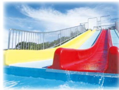
スライダープール