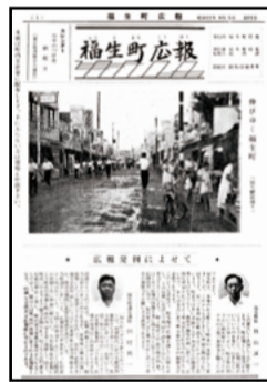
福生初の広報紙。当時のタイトルは「福生町広報」でした。