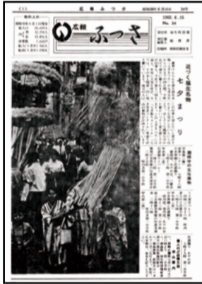
34号からタイトルを「広報ふっさ」に変更し、現在まで続いています。一面では「第13回福生七夕まつり」を紹介。