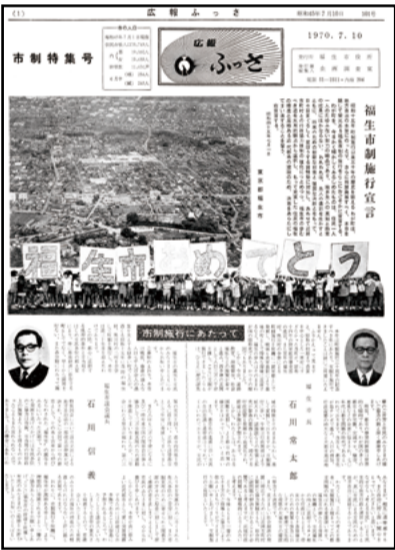
福生「市」に変わって最初の広報紙。当時の人口は38,749人。裏表紙はJR八高線を走行していた蒸気機関車の引退写真でした。