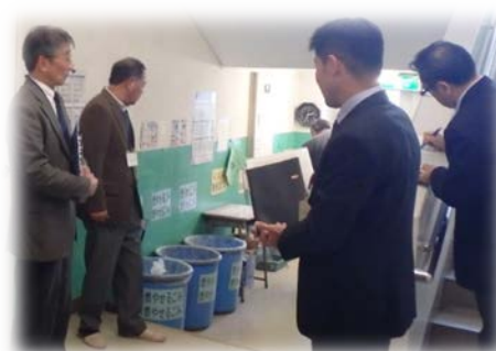
福生第六小学校（監査状況）