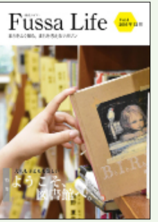
前号の「福生ライフ」

今秋発行予定の市民向け情報誌「福生ライフ」の編集にご協力いただける「市民編集員」を募集します。 【応募資格】 市内在住の18歳以上の方(18歳未満の方は保護者と一緒にご参加ください。) 【募集人員】 5人程度 ※申込み多数の場合は抽選 【活動内容】 企画、取材、原稿作成等情報誌発行までの編集補助業務 ※参加者の都合に応じ、数回の編集会議を行う予定です。 【応募方法】 市役所1階1番秘書広報課広報広聴係窓口に置いてある応募用紙に、必要事項を記入のうえ6月21日(木)までに、直接提出するか、次の事項を記載のうえ、メール(fussalife@gmail.com)でお申し込みください。 〈記載事項〉 ①住所②氏名(ふりがな)③連絡のつきやすい電話番号④生年月日⑤職業⑥やってみたい企画、担当したい編集作業(撮影・編集・企画)等 ※無報酬での活動となりますので、ご理解のうえお申し込みください。 【問合せ】 秘書広報課広報広聴係 ☎551・1529