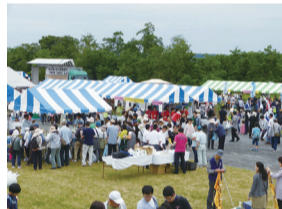
ふっさ環境フェスティバル(昨年の様子)