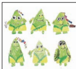
子どもたちによるスケッチ

オリジナルの手作り商品を展示販売します。 〈その他イベント〉バルーンやマジック、工作などの子ども向けワークショップを開催。パフォーマーの出演や、四十雀カフェを中心に福生のグルメも楽しめるなど、今回も盛りだくさんの内容でお届けします。 ※詳細は市民会館ホームページ ( http://fussa-shiminkaikan.jp/ )、フェイスブックをご覧ください。 【問合せ】市民会館 ☎ 552・1711