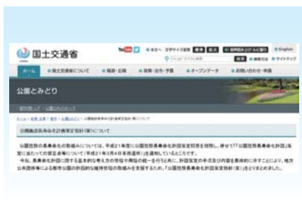
▲国土交通省ホームページに掲載されている指針(案)

市長 本市における公園施設の長寿命化については、公園維持管理方針の中の一分野として取り込もうと考えており、現状の公園をそのまま維持することを前提に考えている。まずは、現状の公園施設を総点検し、公園施設の機能ごとに保全やライフサイクルコストを把握したうえで策定する。