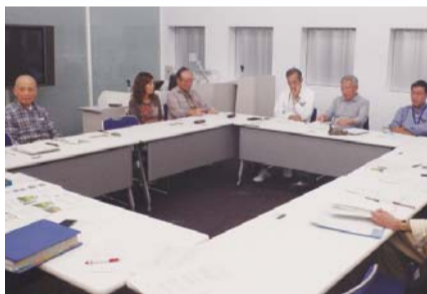
▲花とみどりの会定例会議の様子

市長 市長への手紙やパブリックコメントのほか、市民会議や委員会、審議会等に市民の代表が参画することは、広く市民の意見や提案を聞く有効な機会であり、市政運営において非常に大切な制度である。貴重な意見等に心から感謝したい。今後も多くの意見を寄