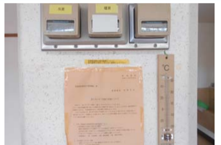
▲地域会館の室内空調設備の様子

教育部長 直接的な苦情はいただけていないが、体感温度は人それぞれに違うことから、各個人での調整をお願いしたい。ただし、健康に害を及ぼすような状況であればお申し出いただき、一時的に温度設定を変えるなどの対応