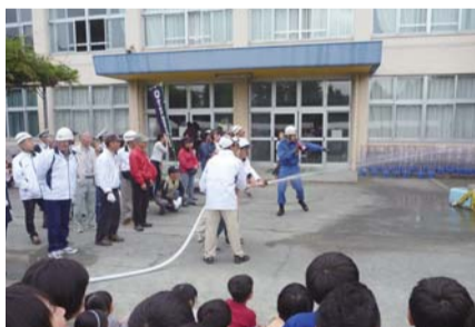
▲昨年の福生市防災訓練の様子

総務部長 今年度は、現在のところ5校で避難所運営連絡会を開催している。残りの小・中学校も、準備ができ