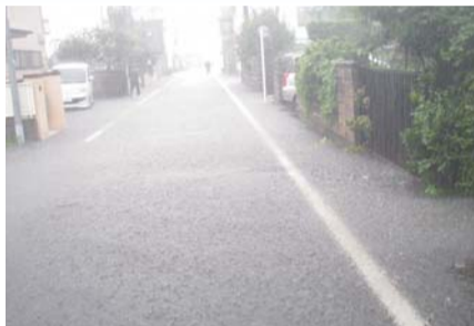
▲台風9号による市内被害の様子

市長 市内の被害は床上浸水2件、床下浸水3件、車両水没2台、道路の亀裂1箇所、人的被害はなかった。市では職員による集水桝の確認等の事前対策や危険箇所の巡回パトロール、職員・消防団による市内警戒、土のうの提供等を実施した。市民や消防団の迅速な対応もあり、被害を最小限に防