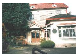
取り壊し前の片倉工場の事務所

戦後は、自転車(シルク号)を生産していたが、平成元年、八王子に移転。取り壊された後は、「片倉跡地」となっている。※「福生歴史物語」によると、森田製糸所は明治六年に創業された、東京府で最初の製糸工場であった。政策と輸出の伸び、好景気の時代に支えられて相当な利益を上げた。やがて、生糸繭価の暴落、関東大震災、金融恐慌などの打撃を受けて衰退した。 トロッコが走っていた 多摩川に東京府砂利工場があった関係で、砂利を拝島駅に運ぶために、ディーゼル機関車でトロッコを