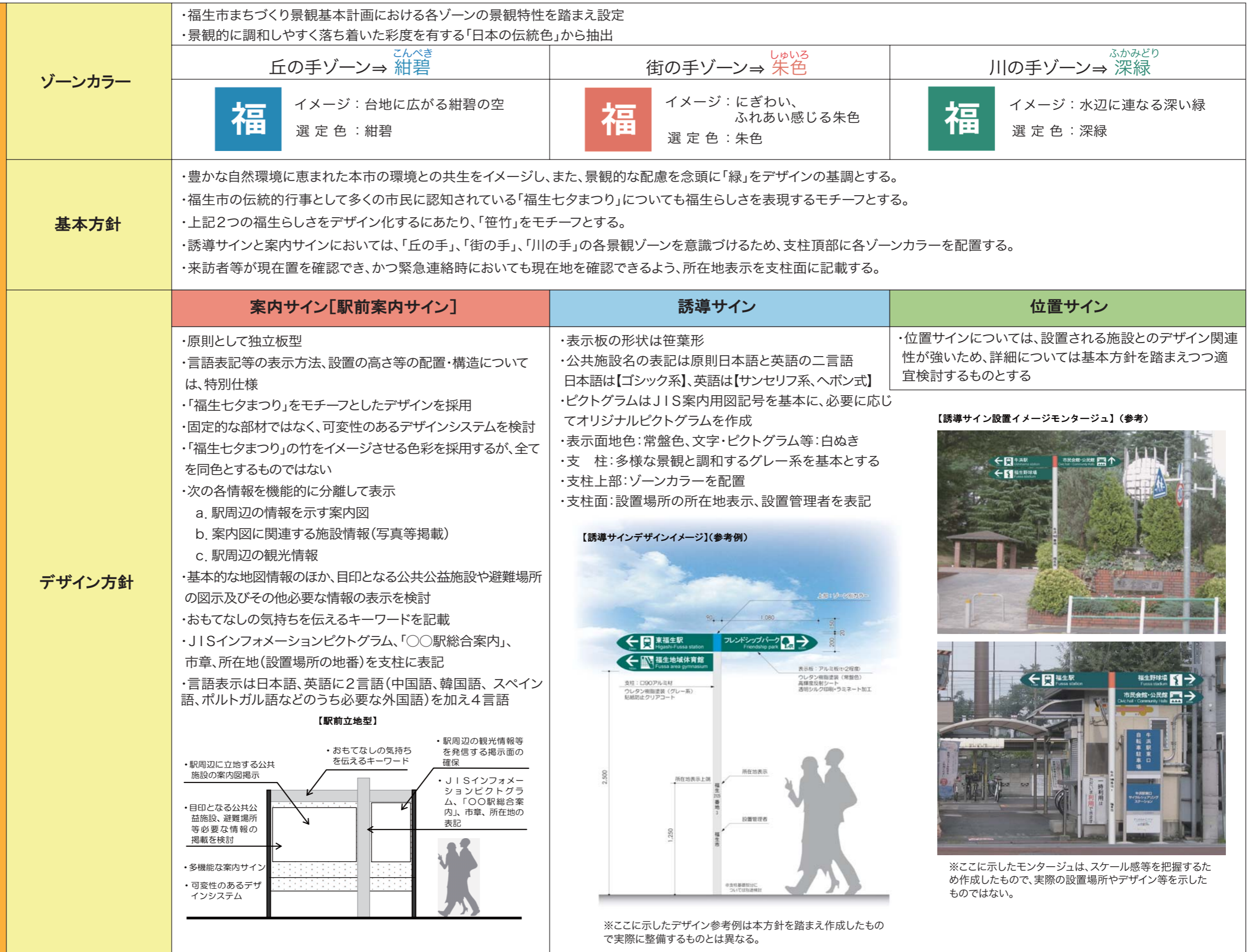
【誘導サイン設置イメージモンタージュ】(参考)